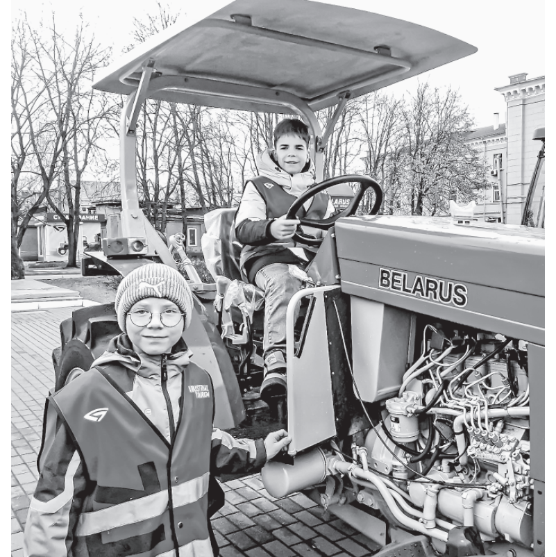
Экскурсия на Минском тракторном заводе.