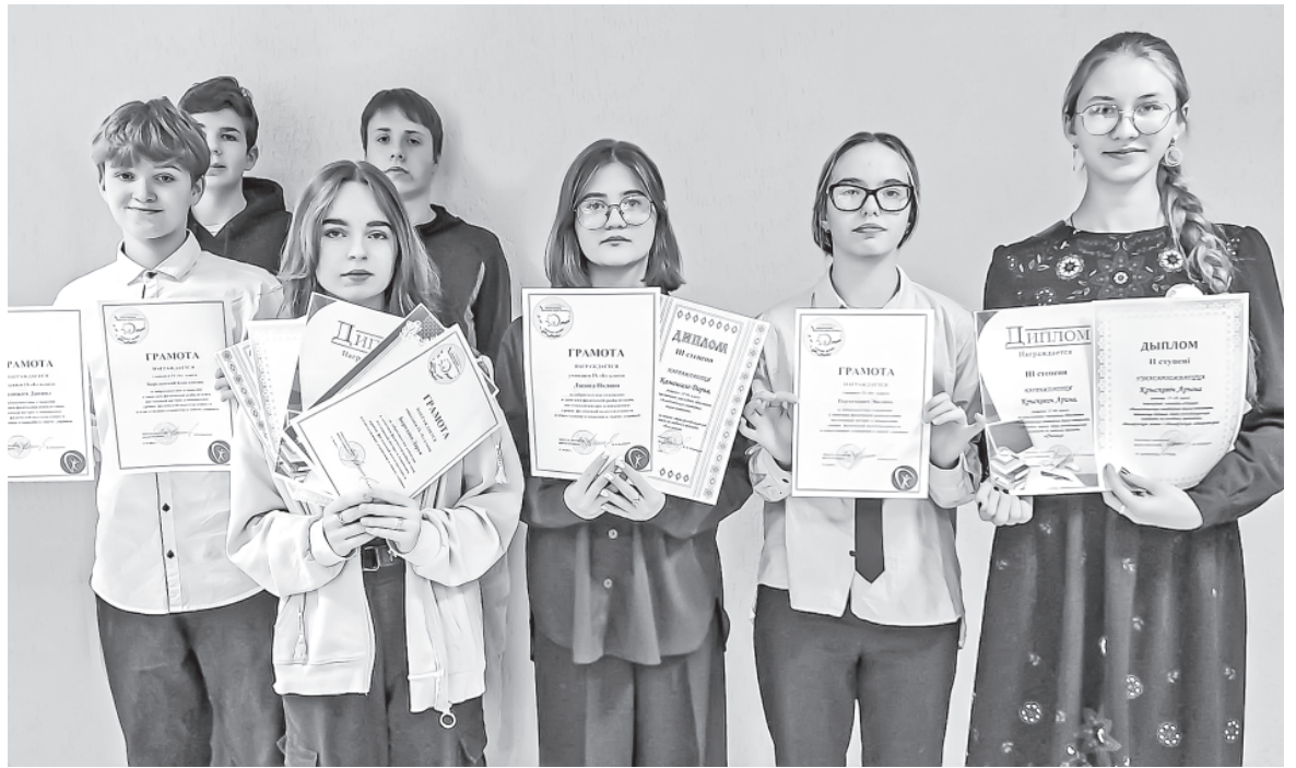
Дипломы за активное участие в учебной деятельности и общественной жизни.