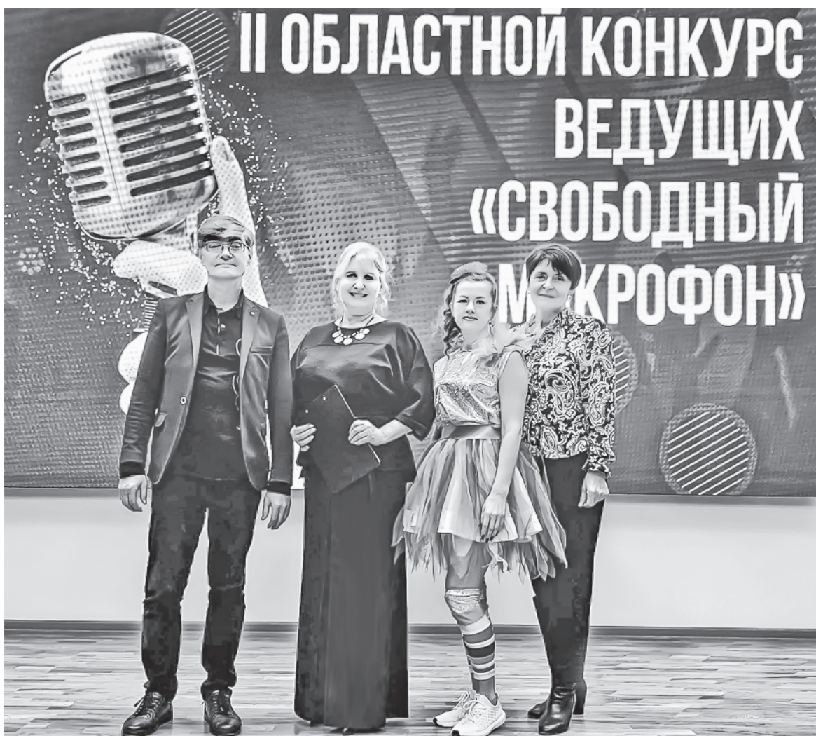
Мы – одна команда.