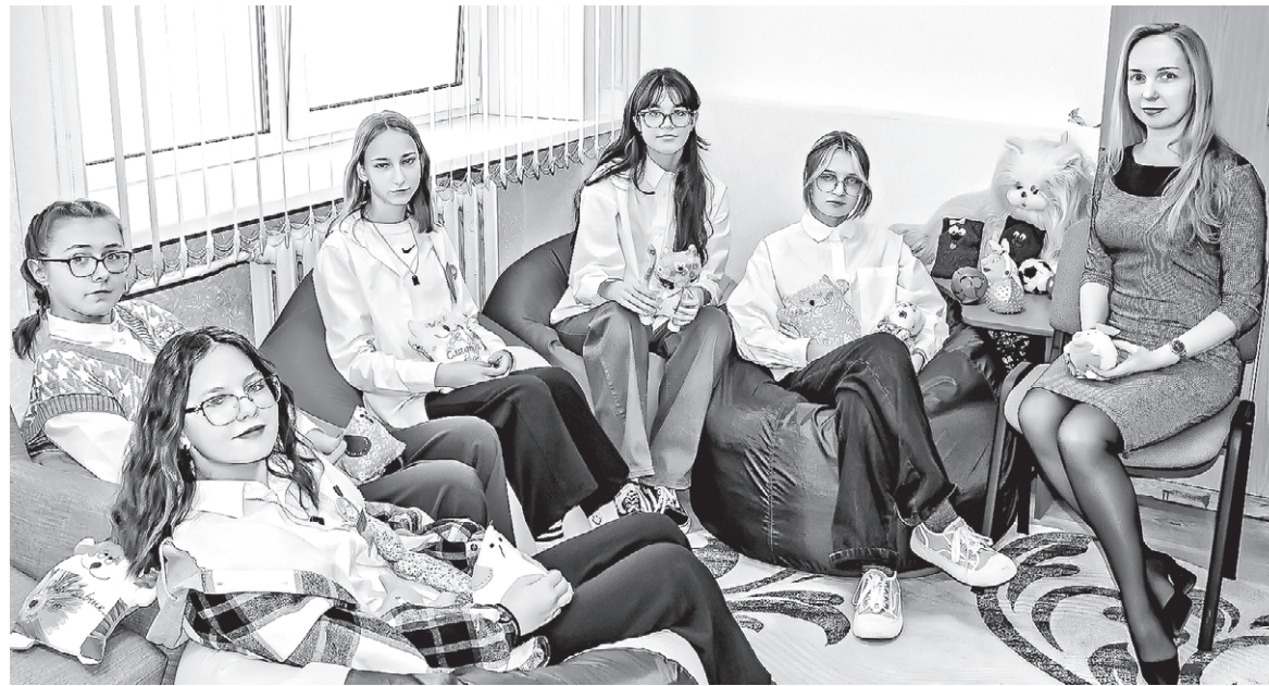
Групповое занятие «Путь к себе».

— Мне нравится работать с людьми, помогать детям обрести веру в себя, стать успешными. Для меня психология — это не только работа, но и жизнь, процесс познания других людей, а также творчество. Работать сложно, потому что большая ответственность. Но